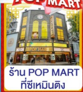
ร้าน POP MART ที่ซีเหมินติง