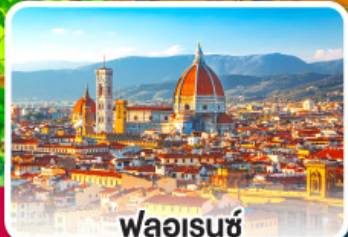
ฟลอเรนซ์

จะพาस्ता, พิซซ่า หรือสปาเก็ตตี้ คงจะดีถ้าได้กินกับเธอ