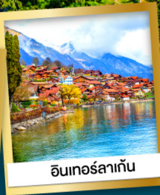
อันเทอร์ลาเกิน