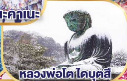
หลวงพ่อดโอบุตสึ