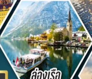
ล่องเรือ ทะเลสาบอัลสติก