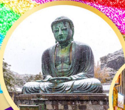
หลวงพ่อดโตโดบุตสึ