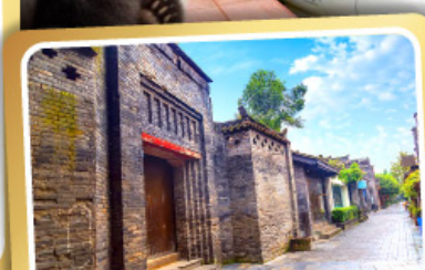
ถนนคนเดินชอยกว้างชวยแคบ