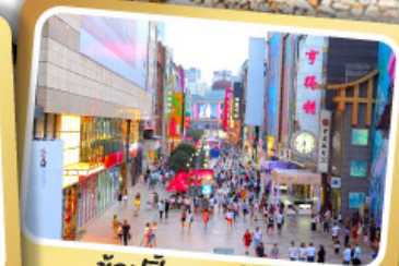
ช้อปปิ้งถนนซิลซิลู