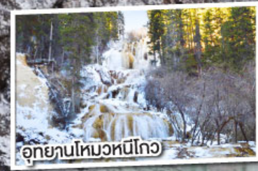
อุทยานโหมวหนี่โกว