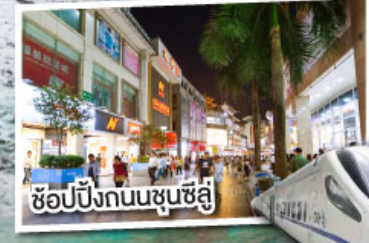
ช้อปปิ้งถนนชุนชี่