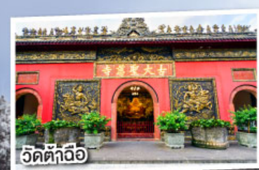
วัดต้าถื่อ