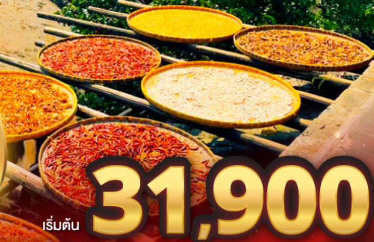
เริ่มต้น