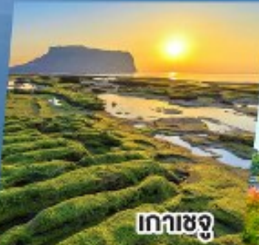
เกาะเชจู