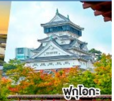
ฟุกุโอกะ