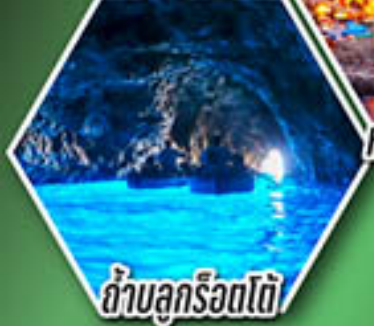
ถ้ำบลูริออตโต้