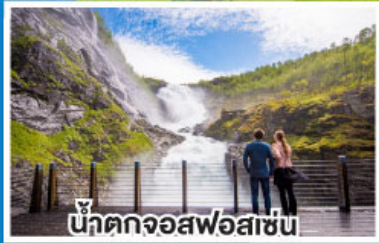
น้ำตกจอสฟอสเซน