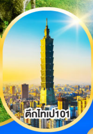
ตึกไท่เปี101