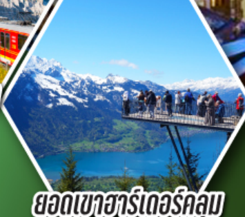
ยอดเขาฮาร์เดอร์คูลม

พักเมืองเชอร์แมก เมืองตากอากาศระดับโลก ที่มีฉากหลังเป็นยอดเขามัตเตอร์ฮอร์น ราคาเริ่มต้น