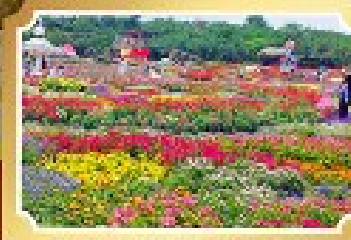
สวนสวรรค์ดอกไม้สีฤดู (Wentuo Mirror)