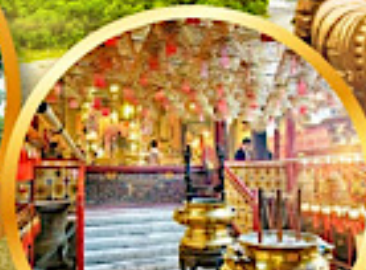
วัดม้านใหม่