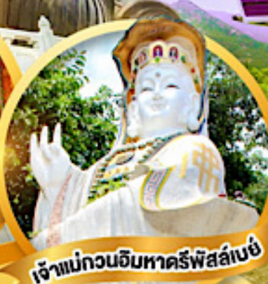
เจ้าแม่กวนอิมหาครีพีส์ลีย์