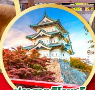
ปราสาทอิชิซากิ