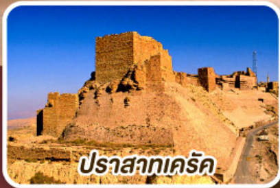
ปราสาทเคิร์ก