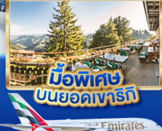
มือพิเศษ บนยอดเขารัก