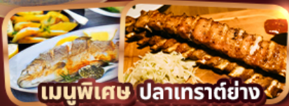
เมนูพิเศษ ปลาเทราต์ย่าง Ribs Of Vienna (1 rack 500g)