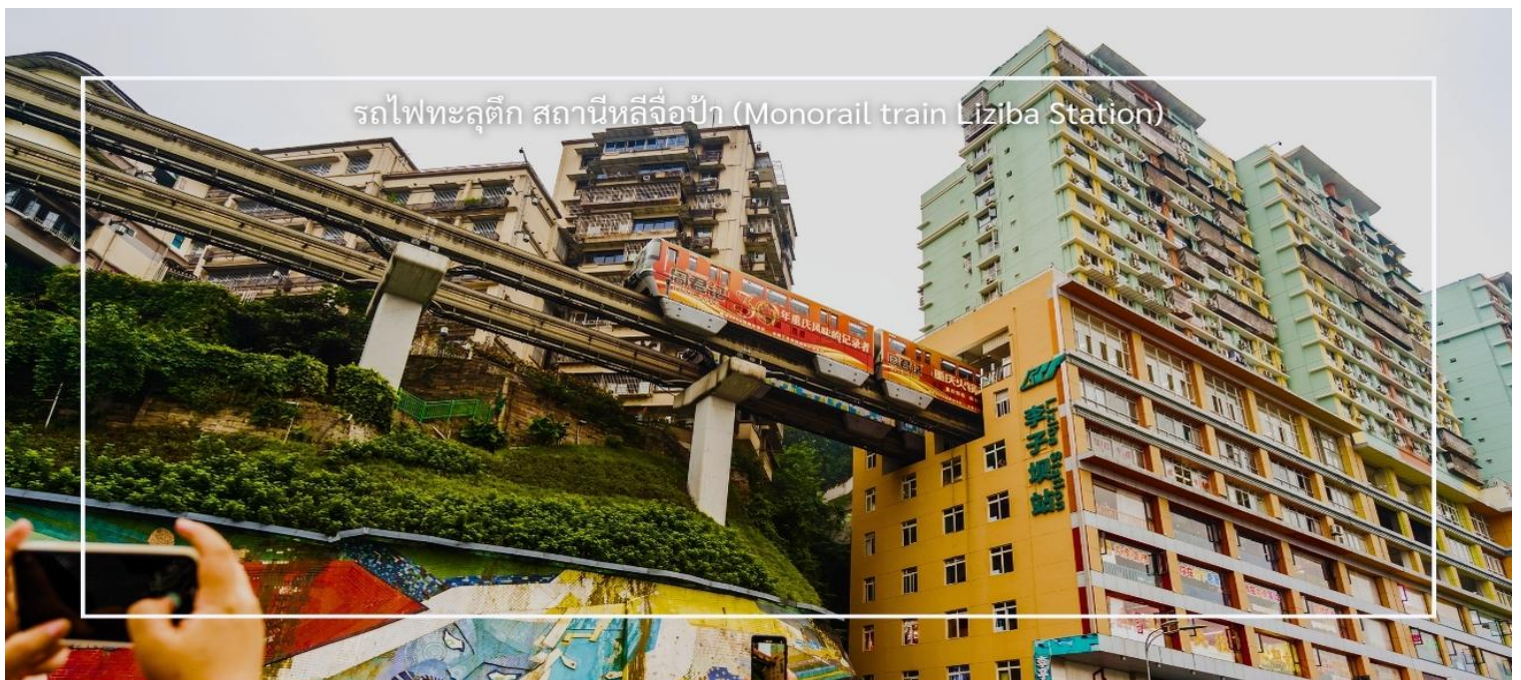
รถไฟทะลุตึก สถานีหลี่จื่อป้า (Monorail train Liziba Station)

นำท่านชม รถไฟทะลุตึก (Monorail Train) หนึ่งในแลนด์มาร์กที่สะท้อนความทันสมัยและเอกลักษณ์ของเมืองฉงชิ่ง รถไฟฟ้าโมโนเรลสาย 2 วิ่งทะลุผ่านตัวอาคารสูงอย่างน่าทึ่ง ซึ่งเป็นวิศวกรรมการสร้างสุดแปลกตา กลายเป็นปรากฏการณ์ที่โด่งดังระดับโลก ท่านสามารถชมและถ่ายภาพโมเมนต์สุดล้ำนี้จากมุมต่างๆ ของเมือง จุดชมวิวนี้นอกจากสร้างความตื่นตาตื่นใจ แต่ยังเป็นสัญลักษณ์ของการผสมผสานระหว่างเมืองสมัยใหม่กับภูมิประเทศที่มีภูเขาและแม่น้ำรายล้อม