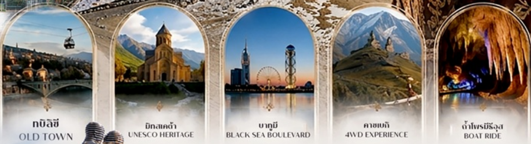
ทบิลีซี OLD TOWN