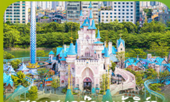
สวนสนุกลิตเติ้ลวิลล์ Lotte Adventure World