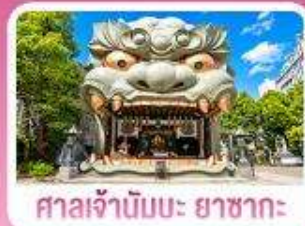
ศาลเจ้านิมมะ ยาชากะ