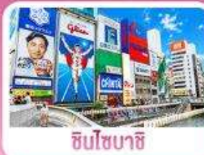
ชิบโฮบาชิ