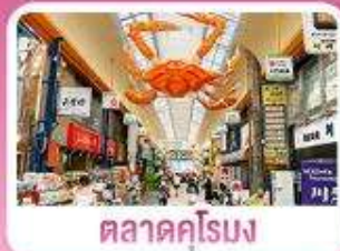
ตลาดคูโรมง

เดินทาง 03 - 07 ก.ค. 69 | 19 - 23 ส.ค. 69 | 25 - 29 ก.ย. 69