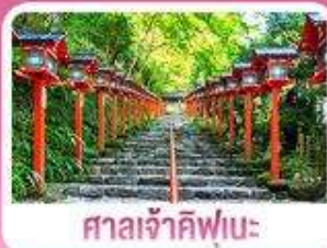
ศาลเจ้าคิฟูมะ