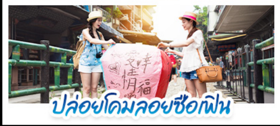
ปลั๊กอินคอมลวยซือเฟิน