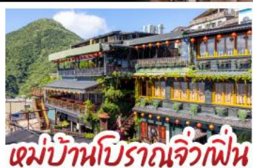
เมบูบ้านโบราณจิวเฟิน