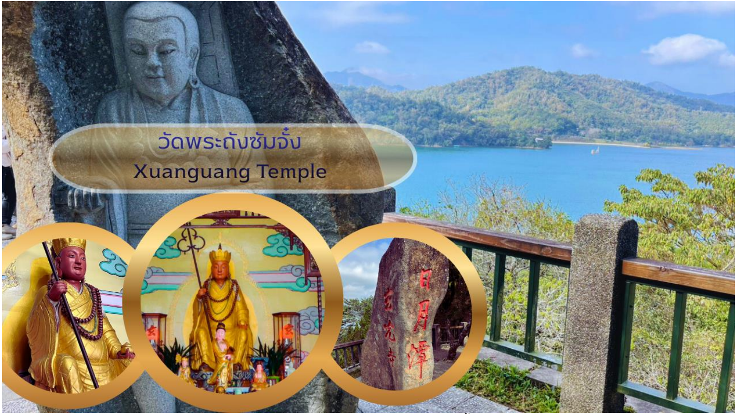
วัดพระถังซัมจั๋ง Xuanguang Temple

นำท่านเดินทางสู่ วัดเหวินหวู่ Wenwu Temple หรือ วัดกวนอู ตั้งอยู่ระหว่างเขาทางทิศเหนือของทะเลสาบสุริยันจันทรา สร้างขึ้นเมื่อปี ค.ศ. 1938 ภายในวัดมีรูปปั้นของขงจื้อและเทพกวนอู (เทพเจ้าแห่งปัญญา และเทพเจ้าแห่งความซื่อสัตย์) ซึ่งชาวไต้หวันเชื่อกันว่า หากได้บูชาเทพเจ้ากวนอู จะได้ประสบความสำเร็จในหน้าที่การงาน มีแต่คนจงรักภักดี หรือหากวางแผนสิ่งใด ก็จะได้ประสบความสำเร็จตามปรารถนา เป็นวัดศักดิ์สิทธิ์อีกแห่งหนึ่งของไต้หวัน แต่เดิมในอดีตริมฝั่งทะเลสาบสุริยันจันทราเป็นที่ตั้งของ 2 วัดเก่า คือวัดหลงฟิง Longfeng Temple และวัดหัวถั่ง Huatang of Shuishotsun ชาวบ้านกล่าวว่าน้ำจากทะเลสาบสุริยันจันทรา จะทะลักเข้ามาท่วมวัดหลงฟิงและวัดหัวถั่ง จึงสร้างวัดเหวินหวู่ขึ้น แล้วรวมวัดทั้งสองแห่งไว้ในวัดเหวินหวู่เพียงแห่งเดียว และสร้างกำแพงให้แข็งแรงยิ่งขึ้น เพื่อรับมือกับน้ำจากทะเลสาบสุริยันจันทราที่หนุนขึ้นสูง ในปัจจุบัน สถาปัตยกรรมของวัดนี้เต็มไปด้วยงานแกะสลักหินจำนวนมาก รวมถึงสิงโตหินอ่อน 2 ตัว ที่ตั้งอยู่บริเวณด้านหน้าของวัดซึ่งมีมูลค่าตัวละ 1 ล้านบาทโดยตัววิหารใหญ่แบ่งออกเป็นสามชั้นและมีวิหารเล็กโอบล้อมอยู่ด้านข้าง และเป็นจุดชมวิวที่สวยงามอีกแห่งหนึ่งของทะเลสาบสุริยันจันทราอีกด้วย