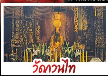
วัดกวนหนี่ท