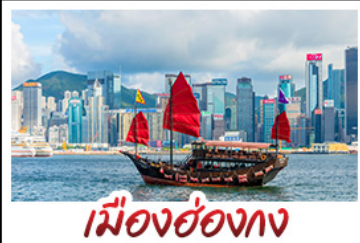
เมืองฮ่องกง

เมืองเก่าชิงเต่า - วิวดูเมืองฮ่องกง โรงเบียร์ชิงเต่า - ท่าเรือชาวประมงเยียนไถ