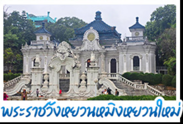
พระราชวังเซวานเหมิงเซวานไห่เหม่