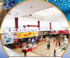
ตลาดกังเป๋ย