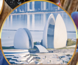
โรงแรมหรูไฮ้มุก