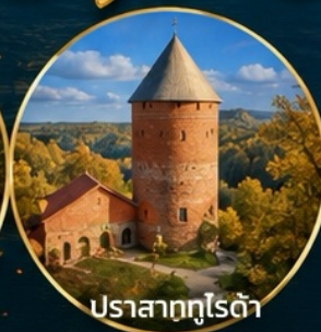
ปราสาทกูโรด้า