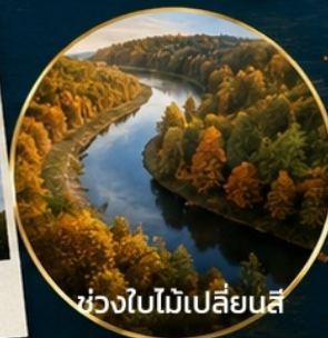
ช่วงใบไม้เปลี่ยนสี