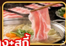
เปิดย่าง+สุกั๊