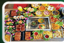
ปิ้งย่าง BBQ