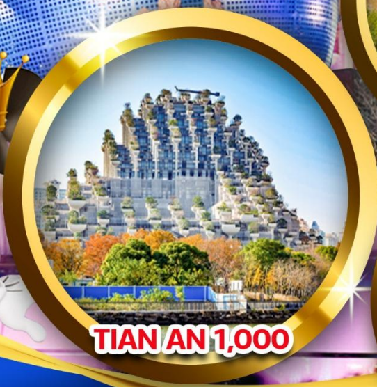
TIAN AN 1,000