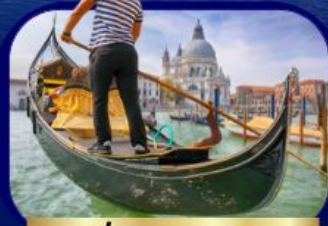
เที่ยวเกาะเวนิส