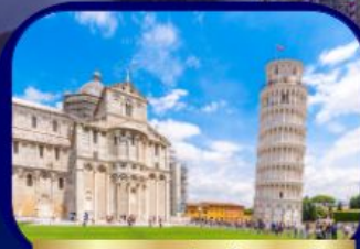
หอเอนแห่งเมืองปิซ่า