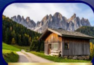
อุทยานฯ โดโลไมท์