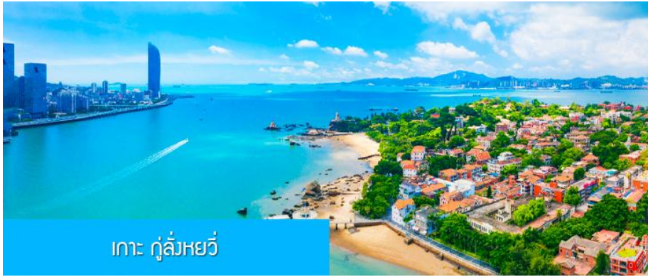
เกาะ กู่ล้งหยวี