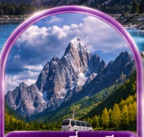
อุทยานสี่ดรุณี (รวมรถอุทยาน)