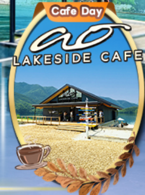
Ao Lakeside Cafe