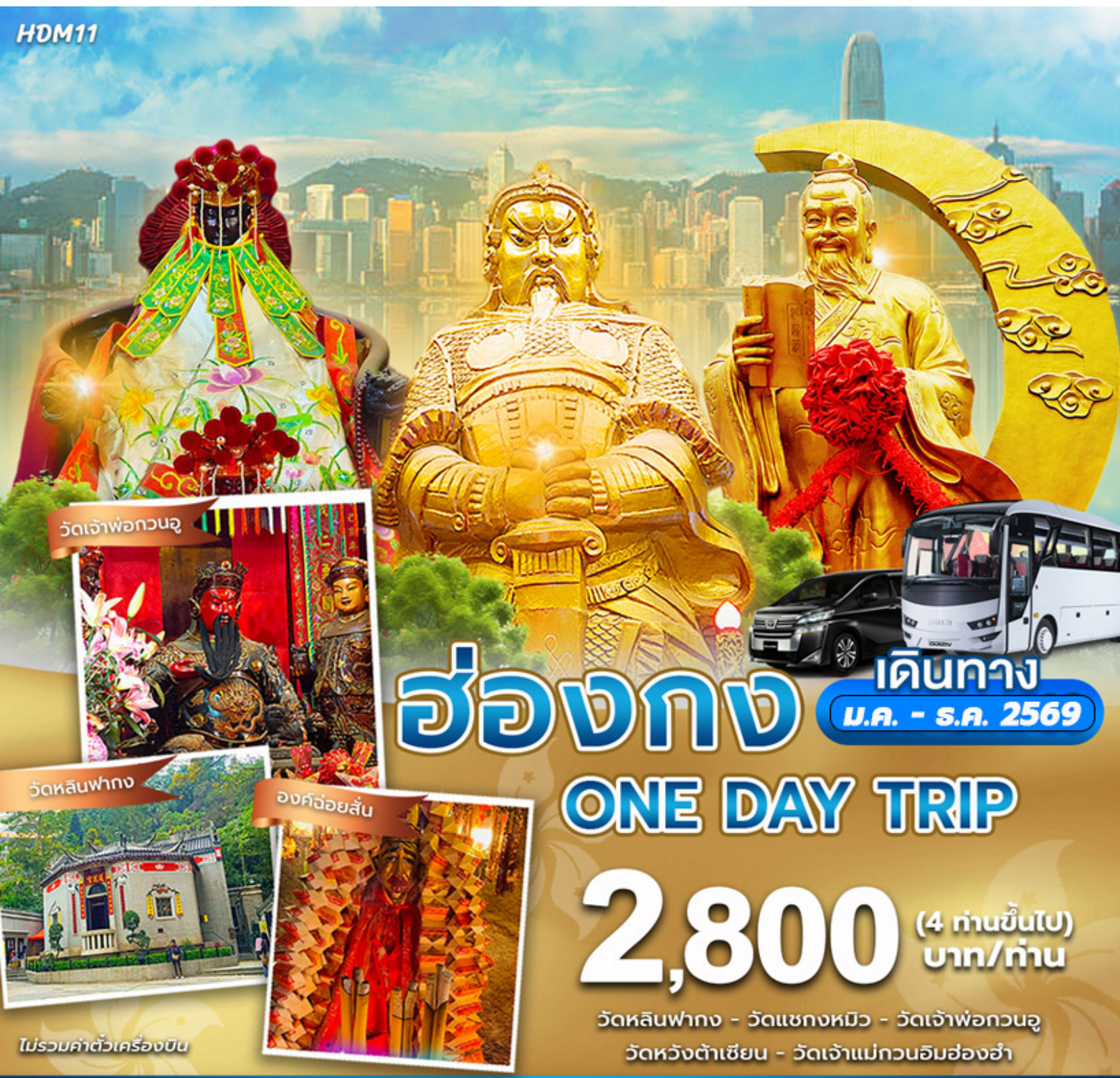
วัดเจ้าพ่อกวนอู