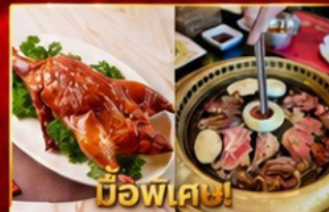
เปิดอย่างฮ่องกง บุฟเฟ่ต์ปิ้งย่างเกาหลี