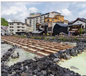
คุซัทสึออนเซน