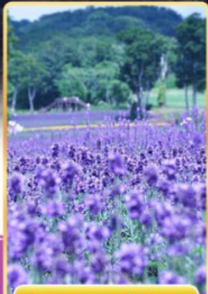
ทุ่งลาเวนเดอร์ทัมบาระ