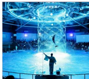
Maxell Aqua Park