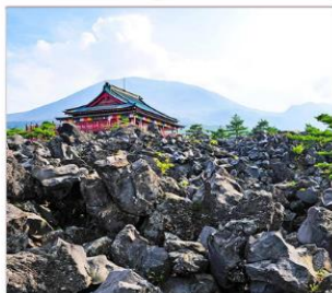
สวนโอนิโอบิตาชิ