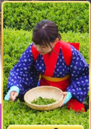
กิจกรรมเก็บชา