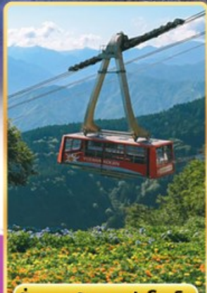
นั่งกระเช้าชูซาว่าโคเอ็น