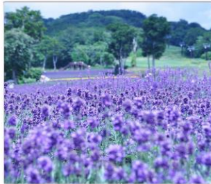
ทุ่งลาเวนเดอร์ทัมมาระ