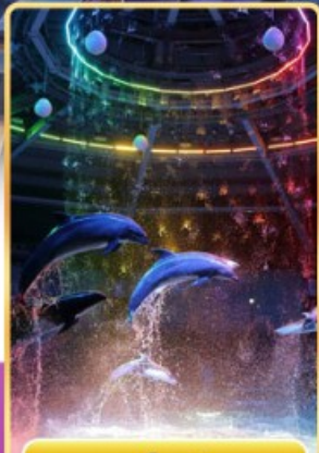
อควาพาร์ค ซินางาวะ