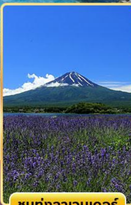
ชมทุ่งลาเวนเดอร์