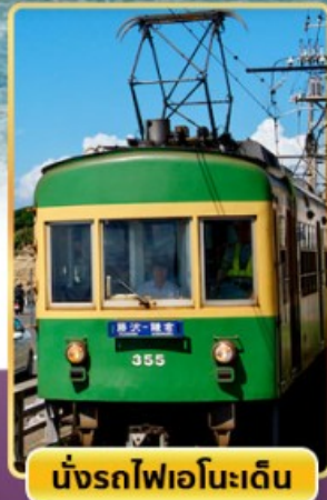
นั่งรถไฟเอโนะเด็ง