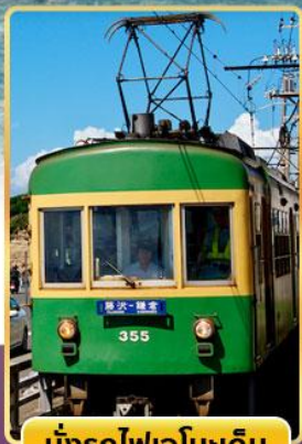
นั่งรถไฟเอโนะดะ