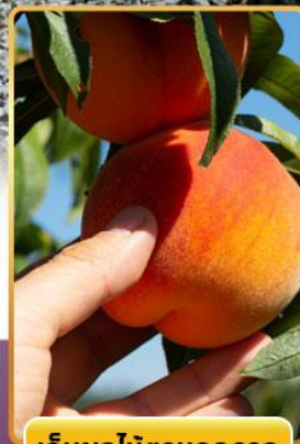
เก็บผลไม้ตามฤดูกาล