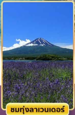
ชมทุ่งลาเวนเดอร์