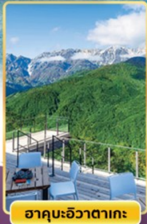
ฮาคุบะฮิวาตากะ