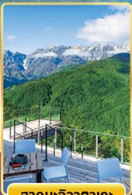
ฮาคุบะฮิวาตากะ