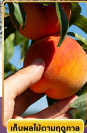
เก็บผลไม้ตามฤดูกาล

🔥 ออนเซ็น 3 คืน 🧳 นน.กระเป๋า 23 กก. ☀️ 8Days 5Night