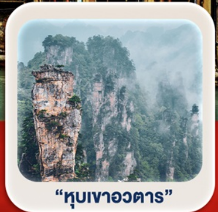
“หุบเขาอวตาร”