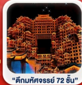
“ตึกมหัศจรรย์ 72 ชั้น”