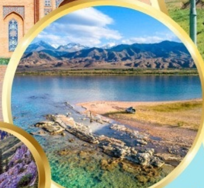
ล่องเรือทะเลสาบอิสซิค