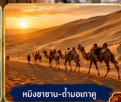
หมิงซาฮาน-กำมอเกา