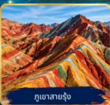
ภูเขาสายรุ้ง