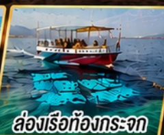
ล่องเรือท้องกระจก