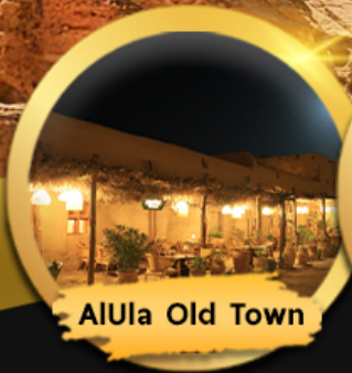
AIUla Old Town