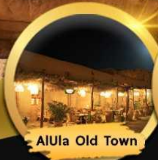
AlUla Old Town