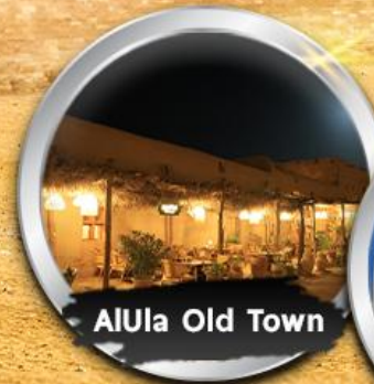
AlUla Old Town