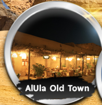
AIUla Old Town