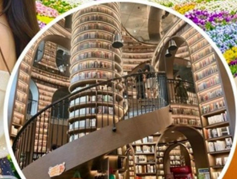
จางชู่เก๋อ

สวนสวรรค์แห่งดอกไม้ MANHUA-จางชู่เก๋อ-จัตุรัสหย่างเกี๋ยมู่-รูปปั้นแพนด้าเซลฟี เมืองโบราณกวนเซียน-อุทยานเขาสี่ดรุณี(รวมปรดอุทยาน)-สะพานหนานเจียว เมืองลั่วใต้-ตึกแฝด-SKP-วัดต้าจื่อ-ถนนคนเดินซุนซีลู่-IFS-ตงเจียวจี้จี้-ถนนคนเดินไท่กุหลี่