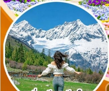
ภูเขาสีดรุณี ช่วงเดียวโกว (รวมรถอุทยาน)